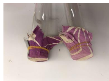
Figur 1: Kajakrør lukket med stof og gummibånd