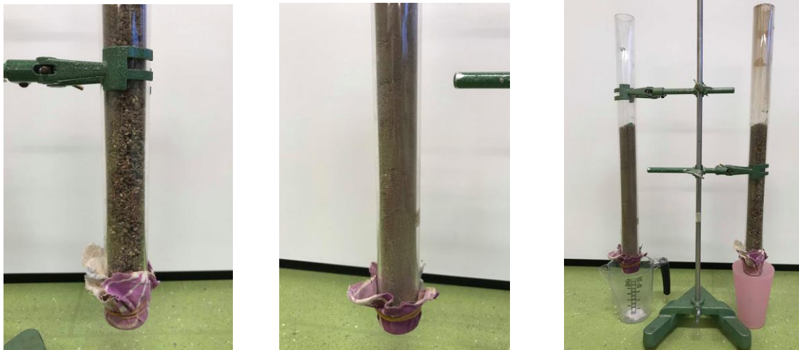
Figur 2: Billeder af forsøgsopstillingen. Fra venstre mod højre: kajakrør med meget store partikler, kajakrør med mindre partikler og den færdige forsøgsopstilling