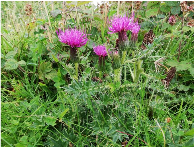
Figur 4: Lav tidsel på overdrevet i Rødme Svinehaver. Bladene med de mange og spidse pigge betyder, at det græssende kvæg på overdrevet undlader at spise tidslen.

Pigge, torne eller hår (Figur 4): Nogle planter har udviklet ubehagelige pigge og torne eller hårlignende vækst for at undgå at blive spist, da planteæderne så i en eller anden grad undgår at spise planterne.