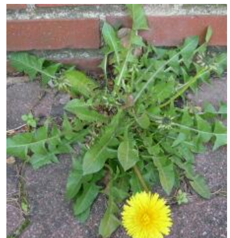
Figur 1: Mælkebøtter danner bladrossetter, som afhængig af græsningstrykket kan være mere eller mindre fladtrykte. Blomstringen kan også foregå helt nede ved jorden. Disse tilpasninger betyder, at mælkebøtter også trives godt i græsplæner, som slås hyppigt, fordi plæneklipperen ikke kan få fat i blade og blomster, når de ligger helt nede ved jorden.

Lavt vækstpunkt (Figur 1): planter med denne type tilpasning danner en såkaldt bladrosset. Afstanden mellem bladene på stængelen er så kort, at bladene kommer til at vokse i en tæt krans lige over jordoverfladen. Dermed bliver bladene svære at få fat i for de græssende dyr, som i stedet vil gå efter plantedele, der rager længere op. Får planterne omkring rosetplanterne lov at vokse i vejret, skygges rosetplanterne bort og de mister deres konkurrencefordel. Mange rosetplanter lader også bladene vokse opad, hvis ikke de græsses.